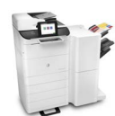
Drucker und Scanner mit Festplattenlaufwerken