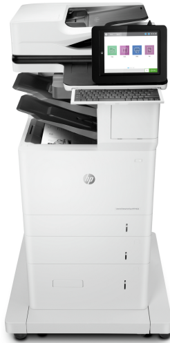
Imprimante multifonction HP LaserJet Enterprise Flow M636z

Cette imprimante multifonction HP LaserJet avec JetIntelligence allie des performances exceptionnelles et une efficacité énergétique pour des documents de qualité professionnelle selon vos besoins, tout en protégeant votre réseau des attaques avec la plus grande sécurité du secteur sur le marché. 1