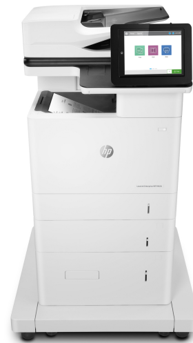
Imprimante multifonction HP LaserJet M636fh Enterprise

Imprimante avec sécurité dynamique activée. Uniquement destinée à être utilisée avec des cartouches dotées d'une puce authentique HP. Les cartouches dotées d'une puce non HP peuvent ne pas fonctionner et celles qui fonctionnent actuellement pourraient ne plus fonctionner à l'avenir. Pour en savoir plus, consultez: