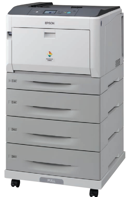
Modèle représenté : Epson AcuLaser C9300D3TNC avec kit recto verso, 3 bacs papier supplémentaires et meuble support