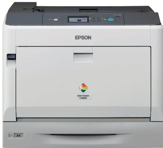
Modèle représenté : Epson AcuLaser C9300N

Les imprimantes couleur laser professionnelles A3 de la gamme Epson AcuLaser C9300N offrent aux entreprises et aux groupes de travail de taille moyenne à grande des impressions d'excellente qualité, grâce à l'une des meilleures capacités d'impression disponibles pour les imprimantes de ce rang.