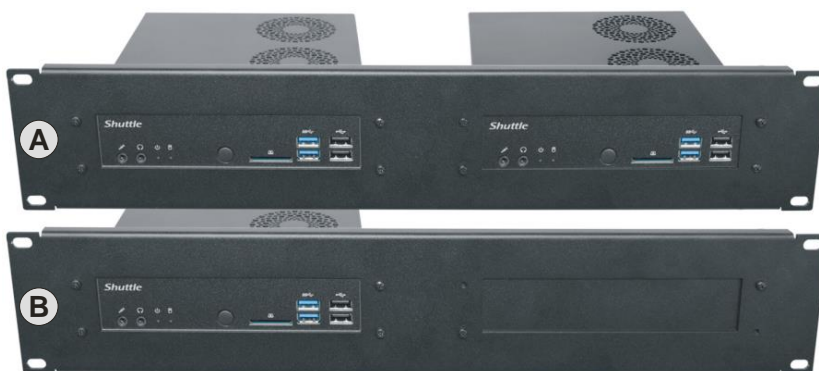
A) zwei montierte PCs B) nur ein PC - plus Abdeckplatte.