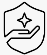
3 Jahre Abhol- und Lieferservice UM917E